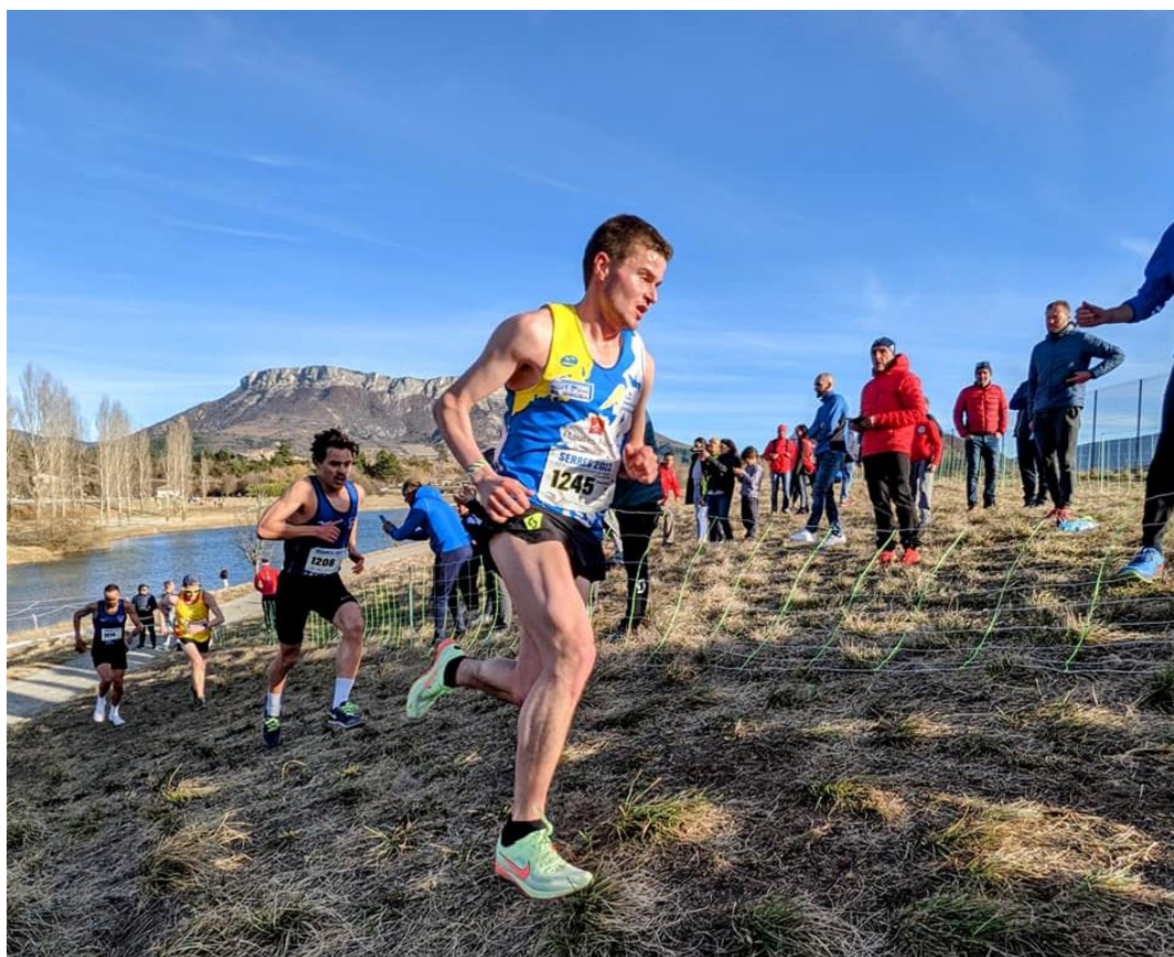
½ finale des Championnats de France de cross-country 2022 à Serres